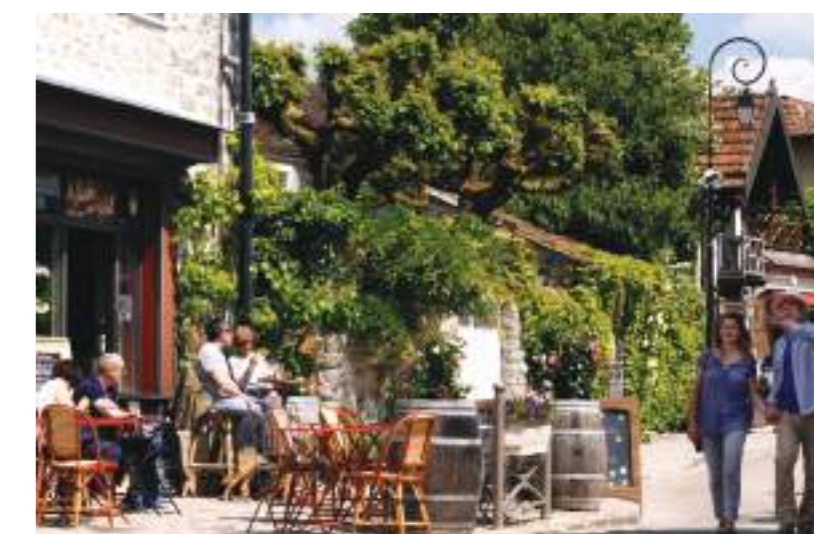
Barbizon, village des Impressionnistes