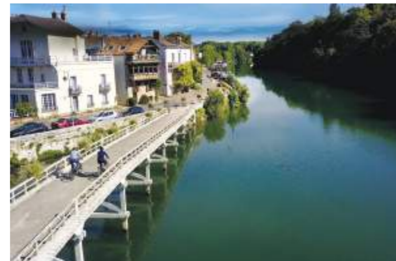
Les bords de Seine