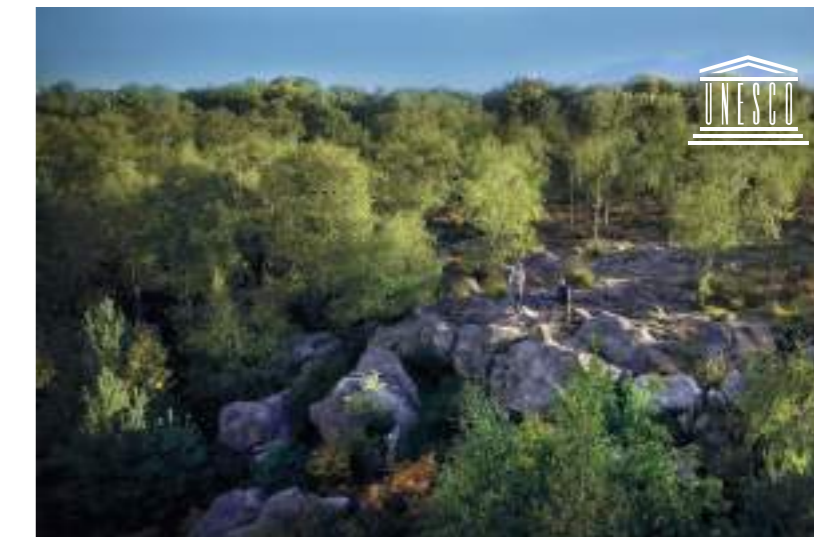
La Forêt de Fontainebleau, 25 000 hectares protégés