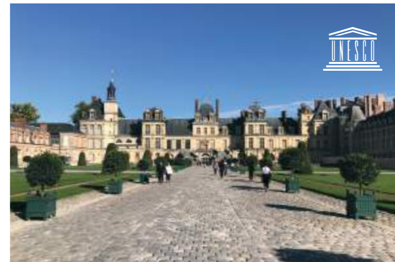
Le Château de Fontainebleau et son jardin à la Française